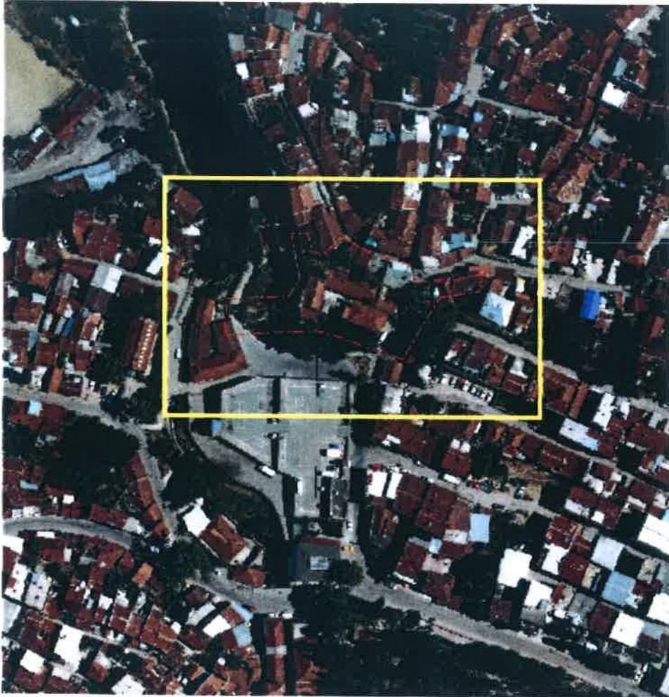
Resim 1: Alana ilişkin uydu görüntüsü

Plan değişikliğine konu alan yaklaşık 8400 m 2 olup, parsellerin bir kısmı Osmangazi Belediyesinin bir kısmı Bursa Büyükşehir Belediyesinin bir kısmı özel mülkiyettedir.